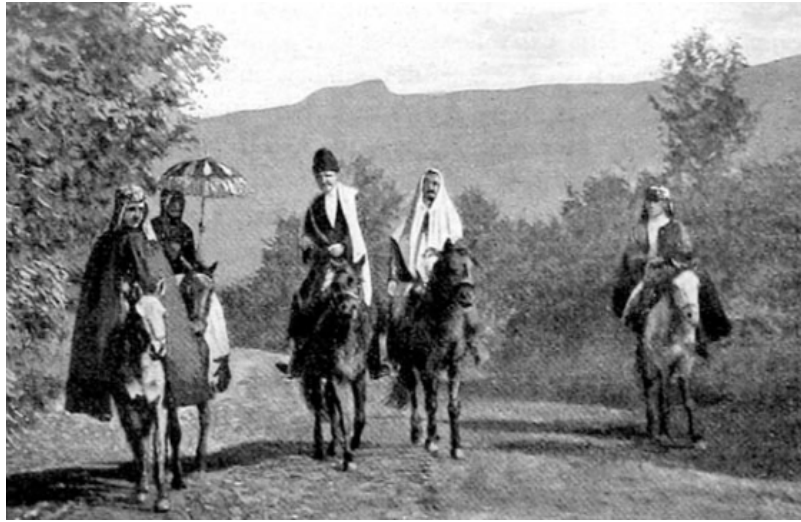
■ Гәыңшыкә иҒеижәу аңсуаа

дацәхәатит. Уи даара ишьахәеит, избанзар абицарақәа ирзынижыт агеограф иҒаарадырратә наңша-аңшрақәеи аныкәақәа иантамтақәеи рҒахәеиҒырышыз аинтерес дутәкәа тҒоу ашәкәы. Аңарауаа илаңш иҒашәоз зда уныкәамшәо аңсабара абакақәа рымацара ракәмыз, иблала ибон зыргылар аиҒыз ақалақәа Ғыңқәа, ажәытә ба-ашкәа рхыжәжәарақәа, аңсадгыл избәхә Ғыргы ирҒадыршәзом. Арахь аныкәақәа иантамтақәа кавказтәаареи аҒылаҒаҒәтәаареи рнахәыла аинтерес рыҒоуп.