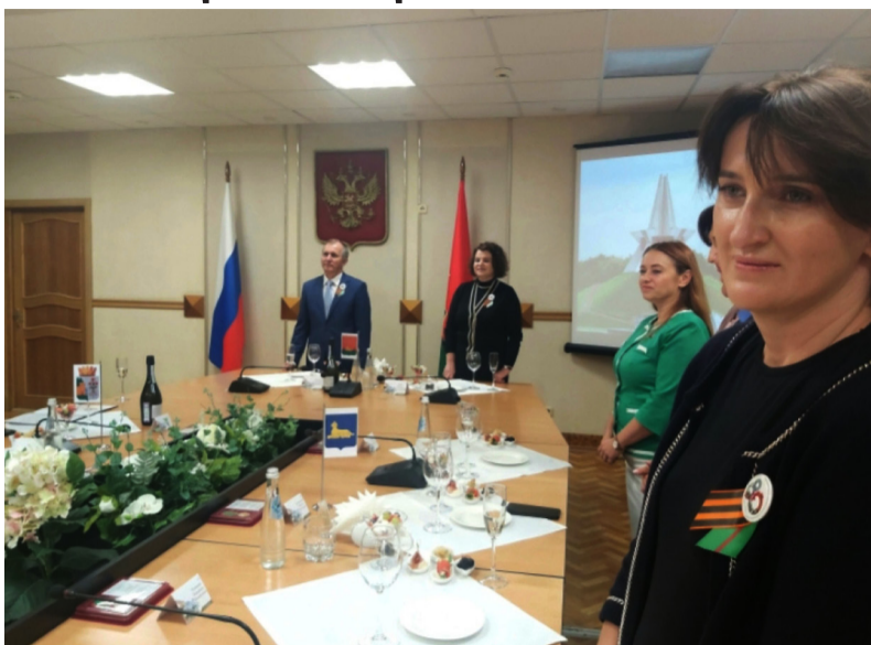
Ақалақь асасцәа «Аңынңтәыләтә еибашыра Дузза аан Брианск ақалақь ахақәиттәра Кәлеижәтәи 80 шықәса атра» хәа агәалашәаратә медалқәа ранащәахейт. Ақалақь агәалашәаратә тыпқәеи арратә мемориалқәеи рәҕы ашәт шытырақәа шытқан.

Аибашыра ианалагәз аены хфырҕхәызба ахәышәтәыртәқы дҕаҕышон. «Атанкқәа ргәыргәырбжыи гон, аха аибашыра иалагеит хәа ххәахыгы иаиуамызт, изакәу зыбжыи го хзеилымкаауа қгачамкны хәқан. Анаоҕс атанкқәа роуп зыбжыи го хәа ажәабж аарылашәит ауаа. «Атанкқәа ааит хәа слымқәа ианаатәс нахыс издыруан ари шеибашыроу. Иааз хықәкыс аихамқәа ахьчара шкәым ирымоу. Ус иагыкалеит, аамтә қәақ