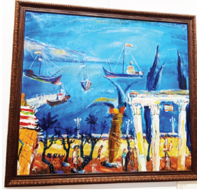
былра зтәам арғиамтә ахәапшәи даднапхьалом.

Асахьахықәә ирылшеит рықә-лакь ашқа ирымоу абзибара ртыхымтәкәә рныргьшра, ағәы-