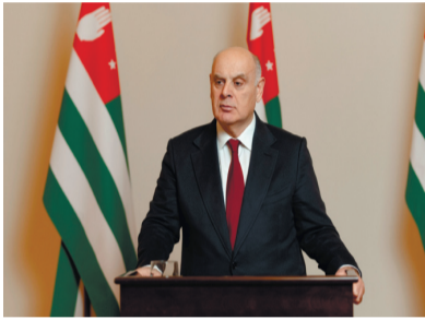
Акыр иаңсоу хәуаажәлар!

Минуткәак рыштыахь хтәыла 2023-тәи Ашықәс ҕыц иаңылоит. Ашықәс ҕыц зегъы хҕәыграқәа адаххәлоит, айтәкра бзиақәа хзаазго ныхәа дуны хазыпшуп. ИКаз ауадафрақәа хаштыахька иньжыны, бзиа иахбо хтаацәа, хашшара, хмызцәа, хәуа-хтәхыра рыгәтаны, насыпгәла хәпәлоит. Хазталоу ашықәс Апъсны азы атцәк чыда амоуп – сынтәа иазгәахтәит Аиааира 30 шықәса ахытәра. Иара убас 15 шықәса цуеит Апъсны Ахәынтқарратә ахыпшымра азхатәуижтәи.