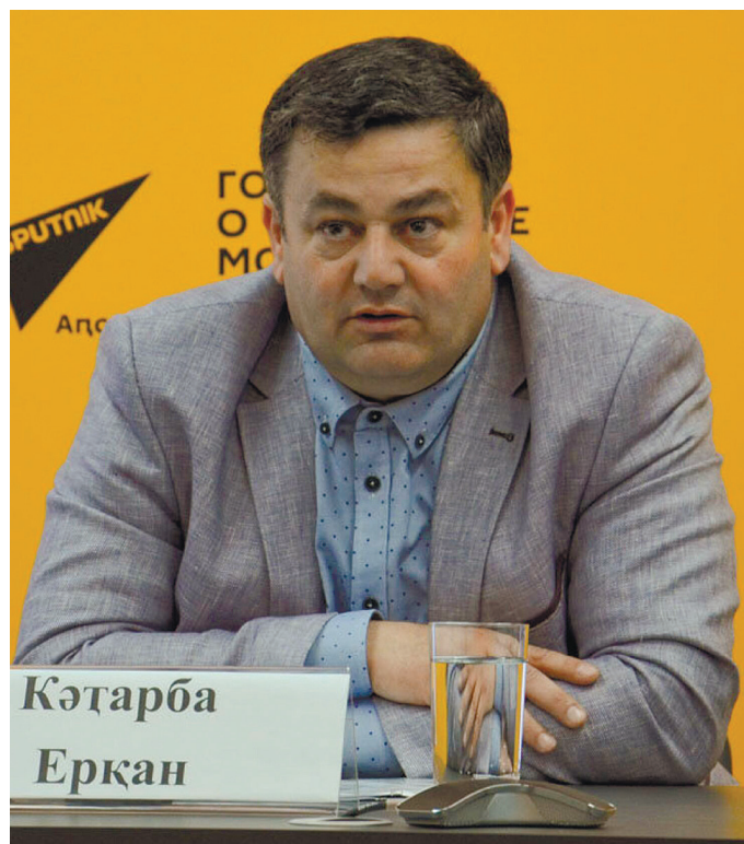
ишызцәеи иарей дук мтыцкәә Гаграка ииасит, аибашьцәә ргәыпқәә руак иалалейт, уа аеазықатцарақәә ирхысуан.

26-шәк еицны Апсныка раара Гагра ахы ианақәитыртәыз аамтә иакәшәеит. Урт реихарафык Диузцәе еиуаз ракәын, икан Адапәзар инхоз азәык-шәыцкәгы. Атагылазашьа еилкааны, ақыртқәә хыпхьазарала ақыр иреитцәз ажәлар абцәарла ирыкәлеит хәә захәз шәыца атырқәәгәгы рыцааит. Азныказы Гәдоута, апсшьарта «Черноморец» ақны ишәнарцеит. Апсныка иаахьаз рапхьатәи агәыпш ашьтахь – ари ашбатәи агәыпш акәын. Ерқан