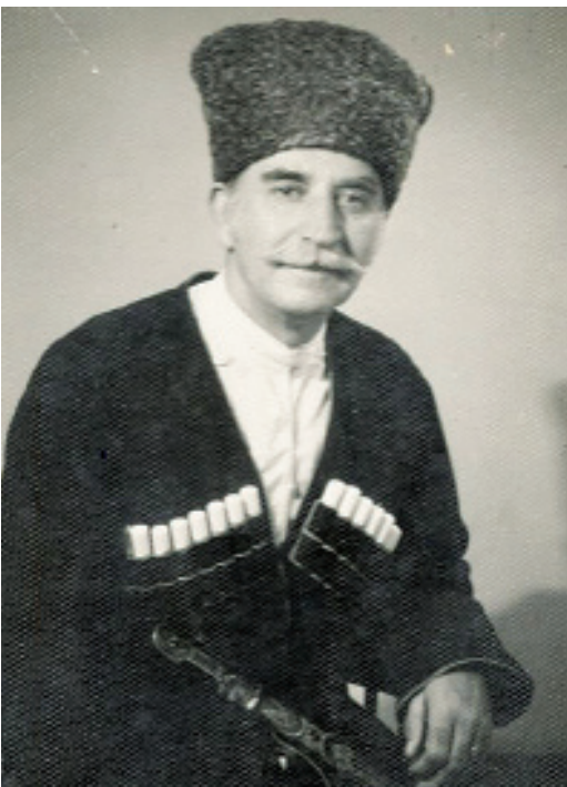
Вл. Анқаб Москва адиссертация анихьчоз абас иеилахәан дцеит

Аизара антәамҗазы ажәа сырҗеит. Акафедраҗы саннеи, итәаз шырацәаз анызба, азныказы исцәыуадао хәит ацәажәара... Азал аҗы икәз Влади-