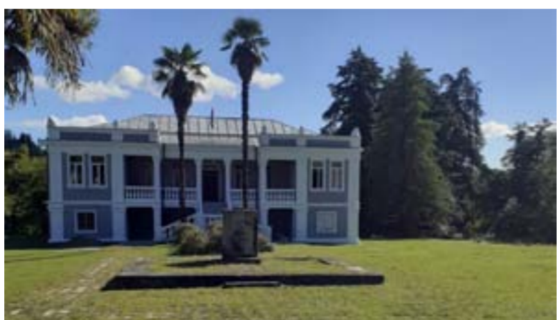
ша-лашо убла иаахьылоит. Тхьына ақытан Анчара ахабла